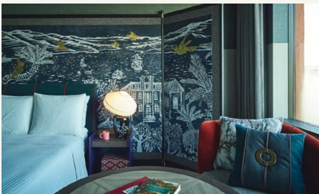
スタンダードツイン 北館

長崎の歴史や文化からインスピレーションを得たデザインの客室。長崎港の開港以後、あらゆるヒトとモノと文化が交差して生まれた独特の世界をご堪能ください。